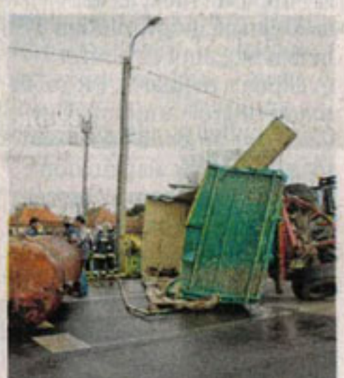
A helyszínelés és mentés útjának mellett zajlott FOTÓ: MATEY ISTVÁN

Pénteken adták át a Balmazújváros és Nagyhegyes között létesített kerékpárutat; az ünnepélyes avatásra azt követően került sor, hogy a résztvevők az új úton tekerve, a két település közigazgatási határán találkoztak. FOTÓ: MATEY ISTVÁN